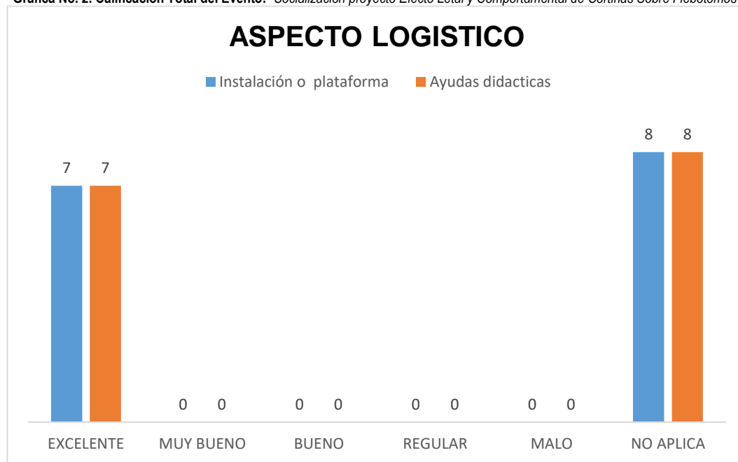
Gráfica No. 2. Calificación Total del Evento: "Socialización proyecto Efecto Letal y Comportamental de Cortinas Sobre Flebótomos"